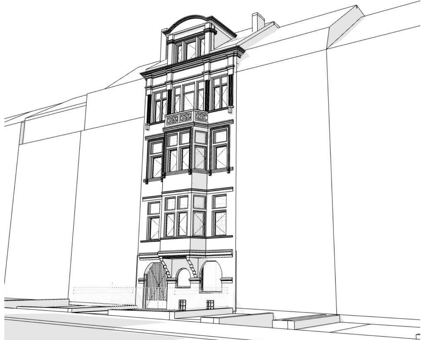
Volumétrie de la façade arrière: situation projetée